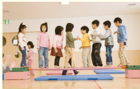
みんなが登園するまで自由遊びです。

実践教育で解決! おかあさんと離れたくない子の対応や、おかあさんとのコミュニケーションなど教科書だけでは学べません。